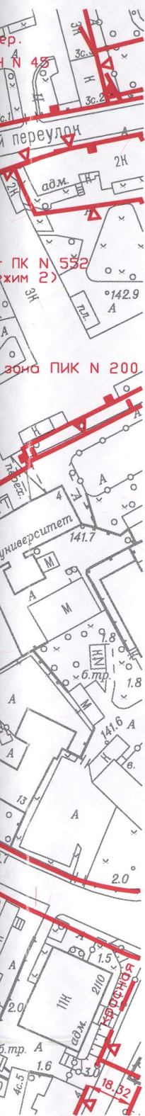
Координаты границ земельного участка